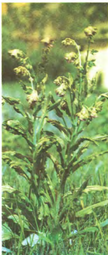
1005. Живокіст лікарський.